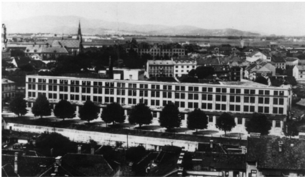
FIGURA 1 – Fábrica Rog nos inícios do século xx